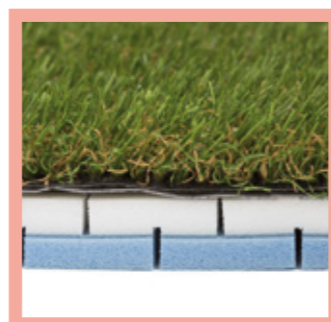
1 lámina 20 mm => HIC 0,9m