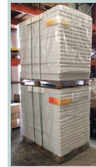
Estabilizador sobre pallet