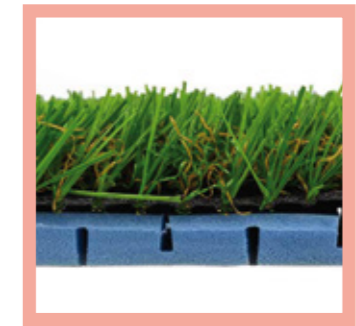
1 lámina 8mm de grueso