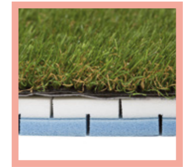
1 lámina 20mm => HIC 0,9m